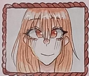
セタさとり SATORI TANABATA